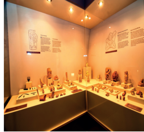
Burgaz Emecik Salonu

Knidos Antik Kentinden gelen eserlerin sergilenmediği Knidos Salonunda kazılardan çıkartılan mermer heykel, heykel başları, figürinler, süs eşyaları, amphoralar ve günlük kullanım kapları sergilenmektedir. Salonunda sergilenen bir heykelle ait bronz kın ve rahip heykeli müzenin en önemli eserlerindedir.