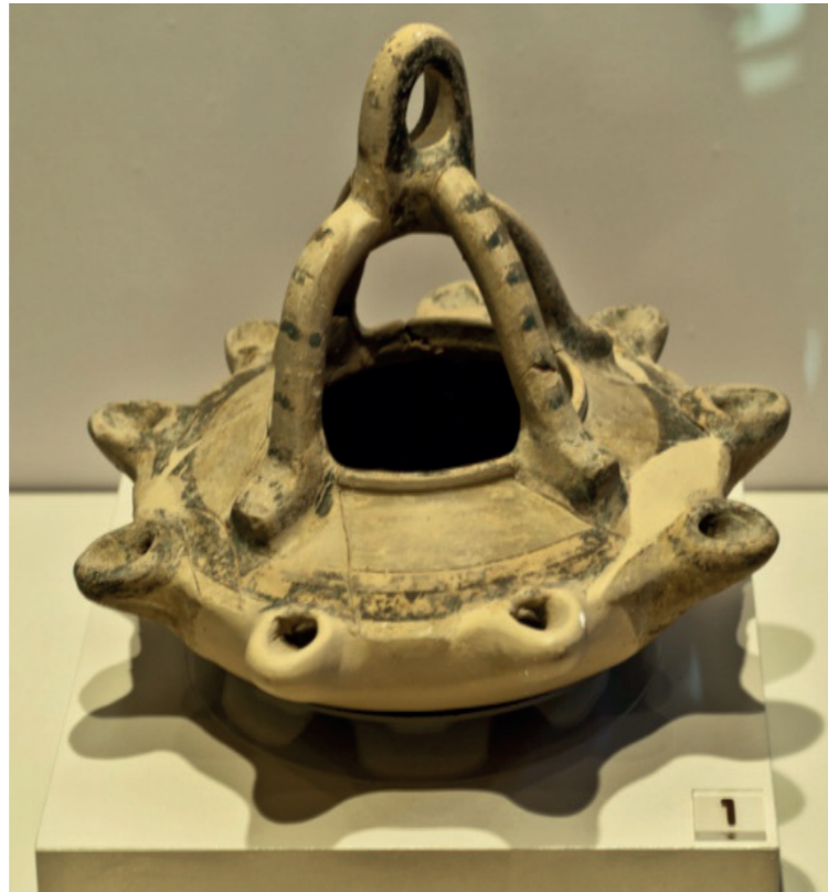
Kandil-Pişmiş Toprak-Arkaik Dönem

Kandiller, antik dönemde en çok kullanılan aydınlatma araçlarıdır. İçine konulan yağ bir fitil yardımıyla yakılarak kullanılmıştır. Arkaik ve klasik dönemlerde çark yapımı pişmiş toprak kandiller, hellenistik dönemden itibaren kalıp yapımı kandillerde kullanılmıştır. Roma döneminde kandiller çoğunlukla kalıpta şekillendirilmiştir. Pişmiş toprak kandiller yanında alçı kalıplarda sıklıkla kullanılmıştır. Çoğunlukla seramik fırınlarında pişirilmiştir. Datça, Emecik köyü'nde bulunan Arkaik Tapınak Kazısında bulunan kandil kenarlarından yukarı doğru yükseltilip yuvarlak bir tutamakla sonlanan dört adet kulba sahiptir. Dış kenarlarında dokuz adet fitil ucu bulunmaktadır. Sahip olduğu form ile benzerlerinden ayrılmaktadır.