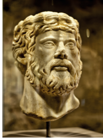
Taş Eserler Salonu

Bu teşhir salonunda Marmaris ve çevresinden Müzemize kazandırılmış olan altın eserler, sikkeler süs eşyaları, figürinler, cam eserler ve günlük kullanım kapları sergilenmektedir. Bu salonda Marmaris ve çevresinde yer alan Phykos, Amos Kastabos, Hydass, Erine, Tymnos, Bybassos, Phoenix gibi çok sayıda Antik Kentin izlerini görmek mümkündür.