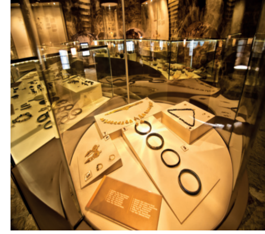
Marmaris ve Çevresi Salonu

Bu salonda bu güne kadar Burgaz Kazılarında ortaya çıkarılan eserler ile emecik köyü yakınlarındaki Apollon kutsal alanında bulunan çoğunluğu kireçtaşı heykelcik ve pişmiş toprak figürinlerin oluşturduğu eserler sergilenmektedir. Arkaik döneme ait olan bu eserler Müzenin en önemli koleksiyonlarını oluşturmaktadır.