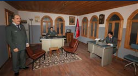
Polise Karakolu Canlandırması, 1970

Müzede, Sultan Abdülmecid döneminden günümüze kadar Emniyet Teşkilatı'nın geçirdiği safhalar, polisin toplumda asayişi sağlarken izlediği yollar, karşılaştığı olaylar, kullandığı araç ve gereçler sergilenmektedir.