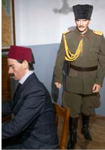
Mustafa Kemal Paşa Canlandırması, 1919