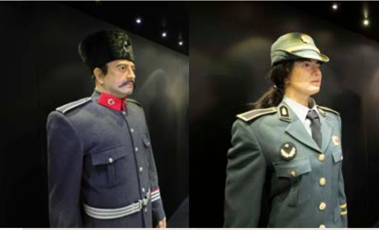
Tarihi Polis Kıyafetleri

Polis Müzesinde; Emniyet Teşkilatı'nın geçirdiği safhalar, polisin toplumda asayişi sağlarken izlediği yollar, karşılaştığı olaylar, kullandığı araç ve gereçler sergilenmektedir.